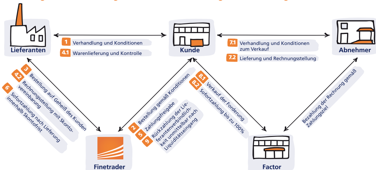
Abbildung 2: Finanzierungsablauf mit Finetrading und Factoring 11)

Zudem weisen diese Unternehmen einseitig kurze Zahlungsziele (null bis 30 Tage) auf und können keine Lieferantenkredite beziehungsweise Skontoabschlüsse durch Bezahlung innerhalb der Skontofrist in Anspruch nehmen. Zusätzlich wird die Liquidität dieser Unternehmen durch eine hohe Kapitalbindung im Warenlagerbestand belastet. Auf der Verkaufsseite weisen diese Unternehmen